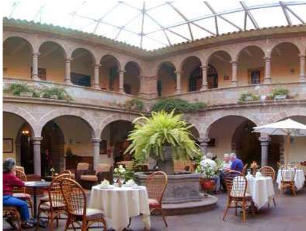
Figura 1. Fotografía del patio interno del Hotel.

Las actividades del hotel se dan en todos los ambientes del monumento histórico: en el primer piso ingreso al lado derecho se encuentra la recepción, e ingresando directamente llegamos al gran patio techado que es un gran hall, con salas de estar, también se ubican mesas del restaurante y comedor del hotel (funciona las 24 hs), y los fines de semana las cenas están acompañadas de espectáculos en vivo, música folclórica, ubicándose los músicos en el gran patio. Las habitaciones se encuentran en el segundo piso, rodeando al patio cuyas ventanas y puertas dan hacia ella; muchas de ellas son originales, mientras que las ventanas sólo conservan la estética original.