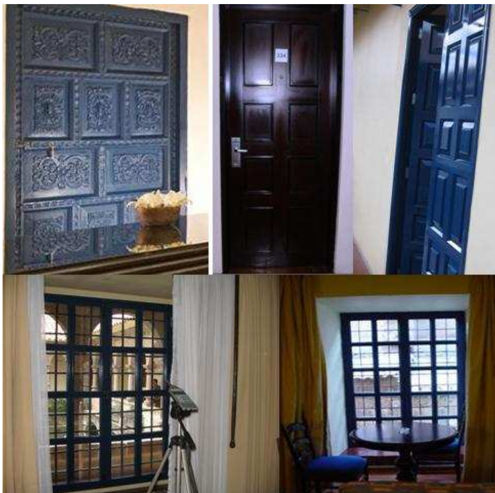
Figura 3. Fotografías de las puertas y mamparas acústicas terminadas.

Se desarrolló un trabajo de ebanistería con todos los detalles para respetar la característica estética original de las puertas y ventanas.